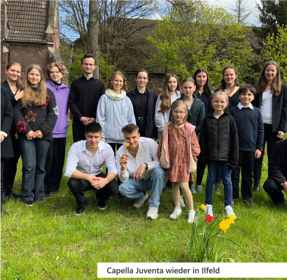
Capella Juventa wieder in Ilfeld